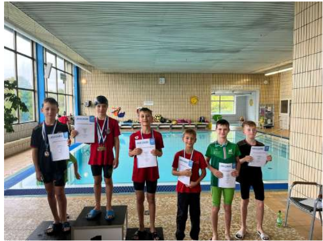
Sieger 25m Rückenbeine

Die Goldmedaille in der Mannschaftswertung gewann hauchdünn der SC Magdeburg mit 408 Pkt., vor der SSV 70 Halle-Neustadt mit 404 Pkt. Die Bronzemedaille sicherte sich das Team des SV Halle mit 339 Pkt.