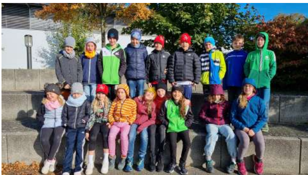
Trainingsgruppe Halle, SSV 70 Halle-Neustadt, Wittenberg

Im Mittelpunkt standen neben dem Techniktraining die Verbesserung der Sprintfähigkeit und die allgemeine athletische Ausbildung an Land auf dem Programm. Das Schwimmtraining wurde 2 x täglich durchgeführt.