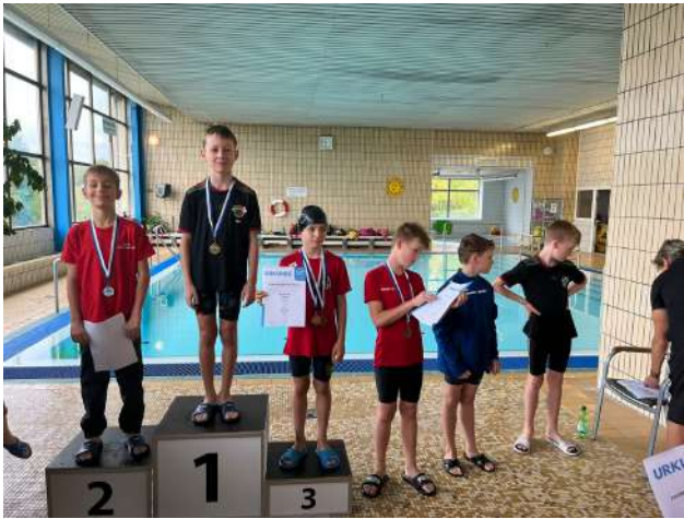
Sieger 100m Lagen