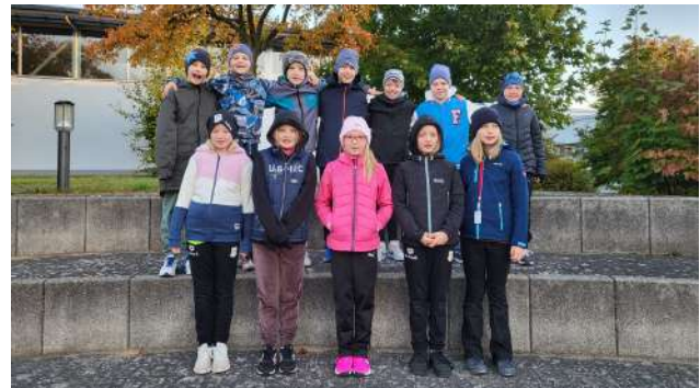
Trainingsgruppe Magdeburg, Zerbst, Schönebeck, Brandenburg

Zum Abschluss fand unsere traditionelle Beachparty statt. Alle Sportler hatten viel Spaß bei unserem Schwimm-Monopoly-Spiel. Das Springen vom 1m Brett war anschließend sehr gefragt, wobei noch ein wenig Eleganz fehlte.