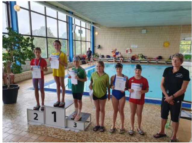
Siegerin 100m Brust