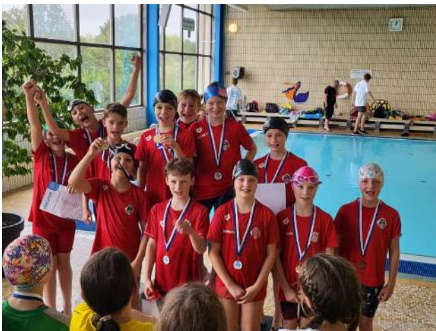
Gold SC Magdeburg

Platz 6: SV Grün-Weiß Wittenberg 236 Pkt. (5 TN)