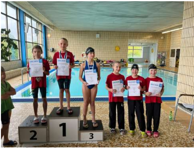
Siegerin 25m Kraulbeine