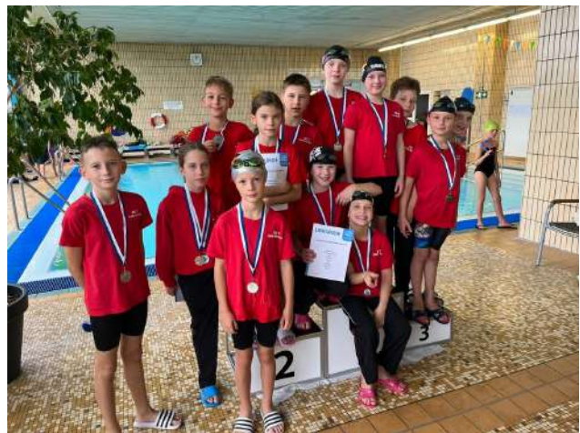
Silber SSV 70 Halle-Neustadt

Herzlichen Glückwunsch an alle Medaillengewinner und platzierten Mädchen und Jungen.